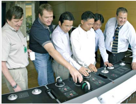
Det er mange utenlandske fagfolk i Kongsbergindustrien, kun 40 prosent etablerer seg på Kongsberg.